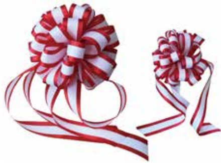
テープカット用リボン花